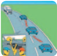
Systèmes d’avertissement de changement de ligne

L’ESC à lui seul est en mesure de sauver au moins 4 000 vies en Europe, et éviter plus de 100 000 blessés chaque année.