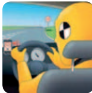
Systèmes d’alerte de dépassement de vitesse