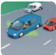
Système de surveillance des angles morts