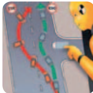
Contrôle de stabilité électronique (ESC)