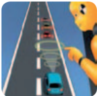
Systèmes de gestion des interdistances et de freinage